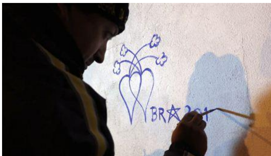
Figura 2: Registo fotográfico do ambiente ritual do Pintar e Cantar dos Reis, Alenquer.

Nota: Imagem reproduzida a partir da documentação visual associada à ficha “Pintar e Cantar dos Reis” do Inventário Nacional do Património Cultural Imaterial (Património Cultural, s.d.).