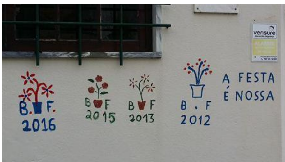
Figura 3: Registo fotográfico de motivos pictóricos do ritual no espaço doméstico, Alenquer.

Nota: Imagem reproduzida a partir da documentação visual associada à ficha “Pintar e Cantar dos Reis” do Inventário Nacional do Património Cultural Imaterial (Património Cultural, s.d.).