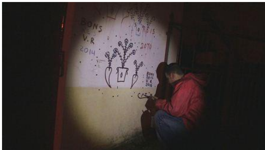
Figura 1: Registo fotográfico de pinturas do ritual em fachada residencial, Alenquer.